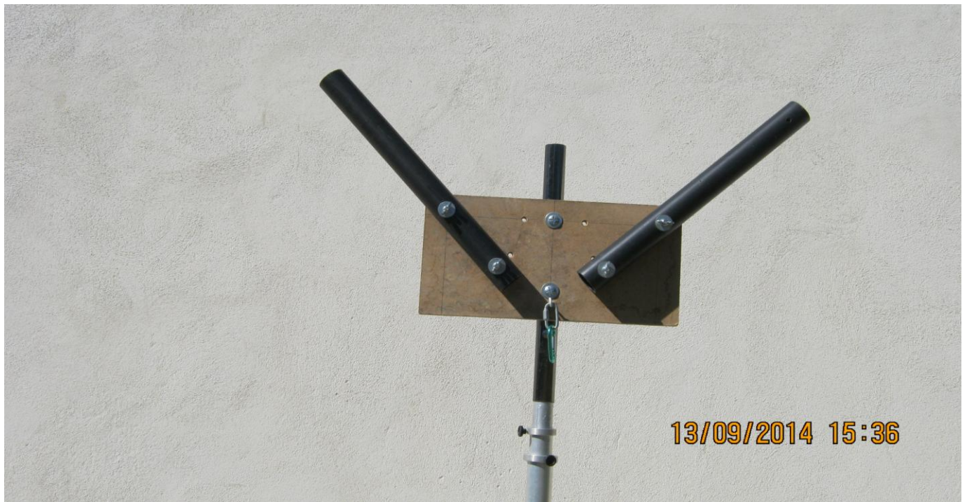
VUE DE FACE DU SUPPORT EN « V »

Il s'agit d'une planche de bois en aggloméré assez dense fruit du hasard de la récup... HI... Largeur 45 cm hauteur 22.5 cm épaisseur 19 mm.