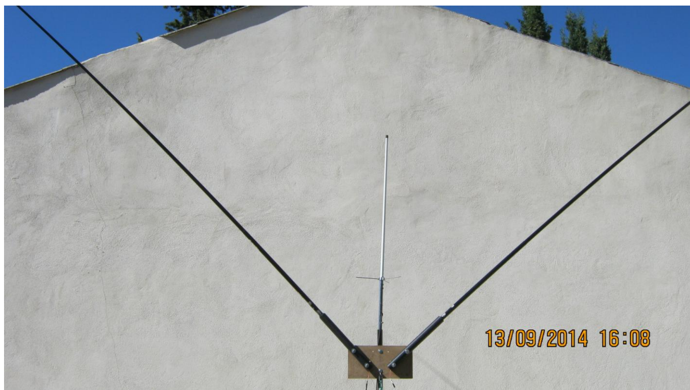
VUE D'UNE ANTENNE BI-BANDES VHF-UHF INSTALLEE AU MILIEU DE L'ANTENNE EN « V »

Il a suffi de placer le balun à l'extérieur du véhicule sur une petite table avec 3 mètres de coaxial jusqu'à la boîte pour que l'accord se fasse normalement.