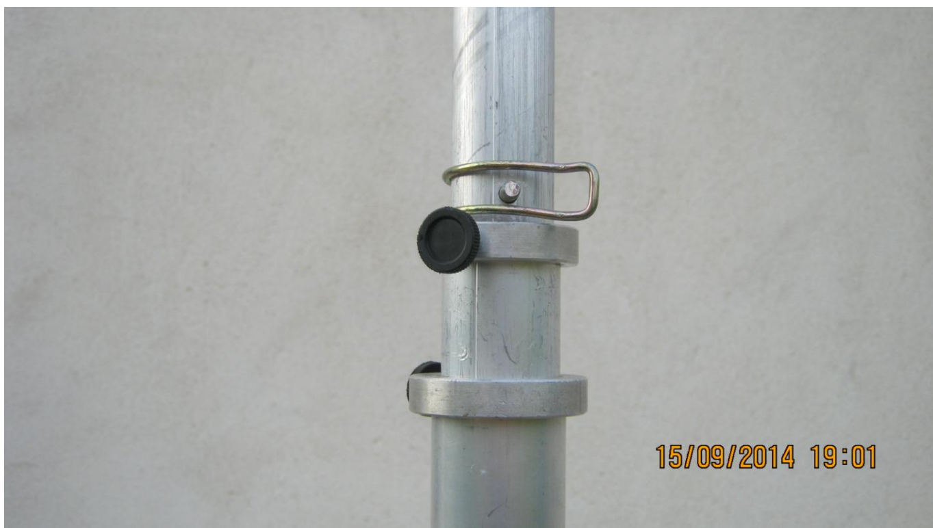
VUE D'UNE GOUPILLE DE VERROUILLAGE DU MAT TELESCOPIQUE

Le mat télescopique replié mesure 1.50 mètres de sorte qu'à ce stade du montage, on peut aisément mettre en place la platine support des cannes à pêches.