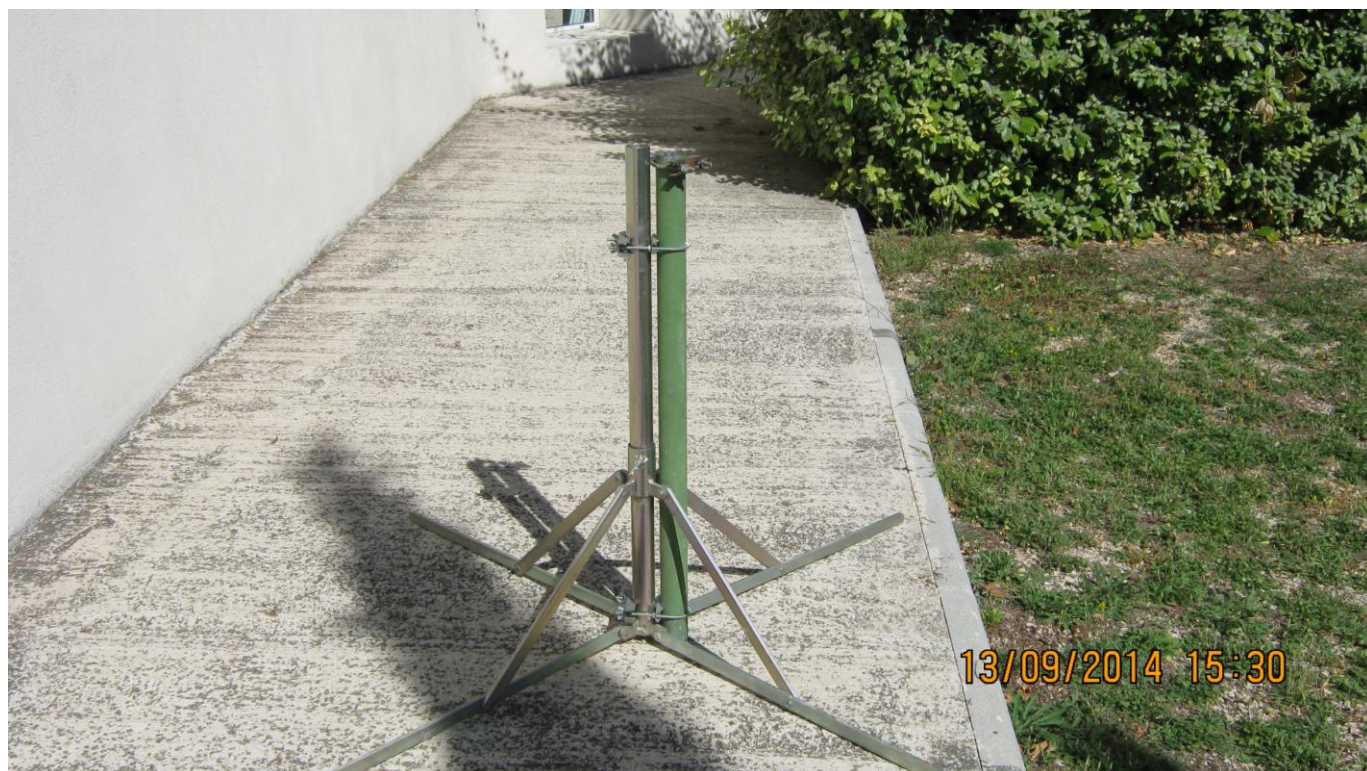
VUE DE L'ADAPTATEUR MONTE SUR LE PIED DE PARASOL

Le troisième cavalier en haut du tube sert à bloquer en rotation le mat aluminium.