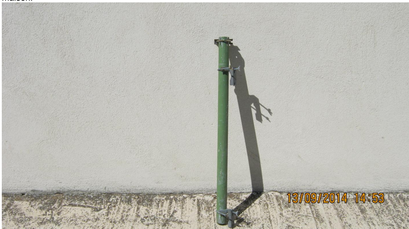
VUE DE L'ADAPTATEUR ENTRE LE MAT ALUMINIUM ET LE PIED SUPPORT

J'utilise personnellement des blocs de béton de 10 kg munis de poignées de transport fabrication maison.