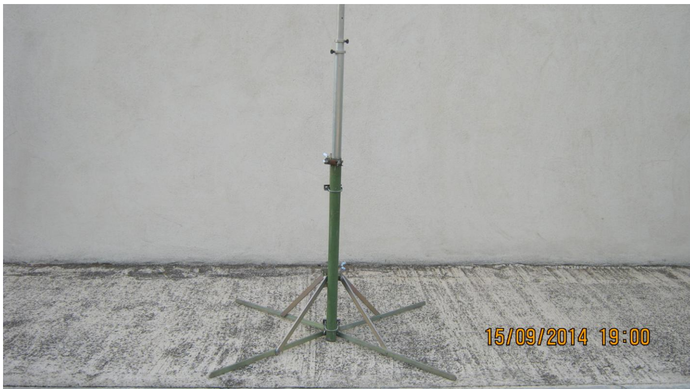
VUE DU MAT TELESCOPIQUE SUR LE PIED SUPPORT

Le mat télescopique replié mesure 1.50 mètres de sorte qu'à ce stade du montage, on peut aisément mettre en place la platine support des cannes à pêches.