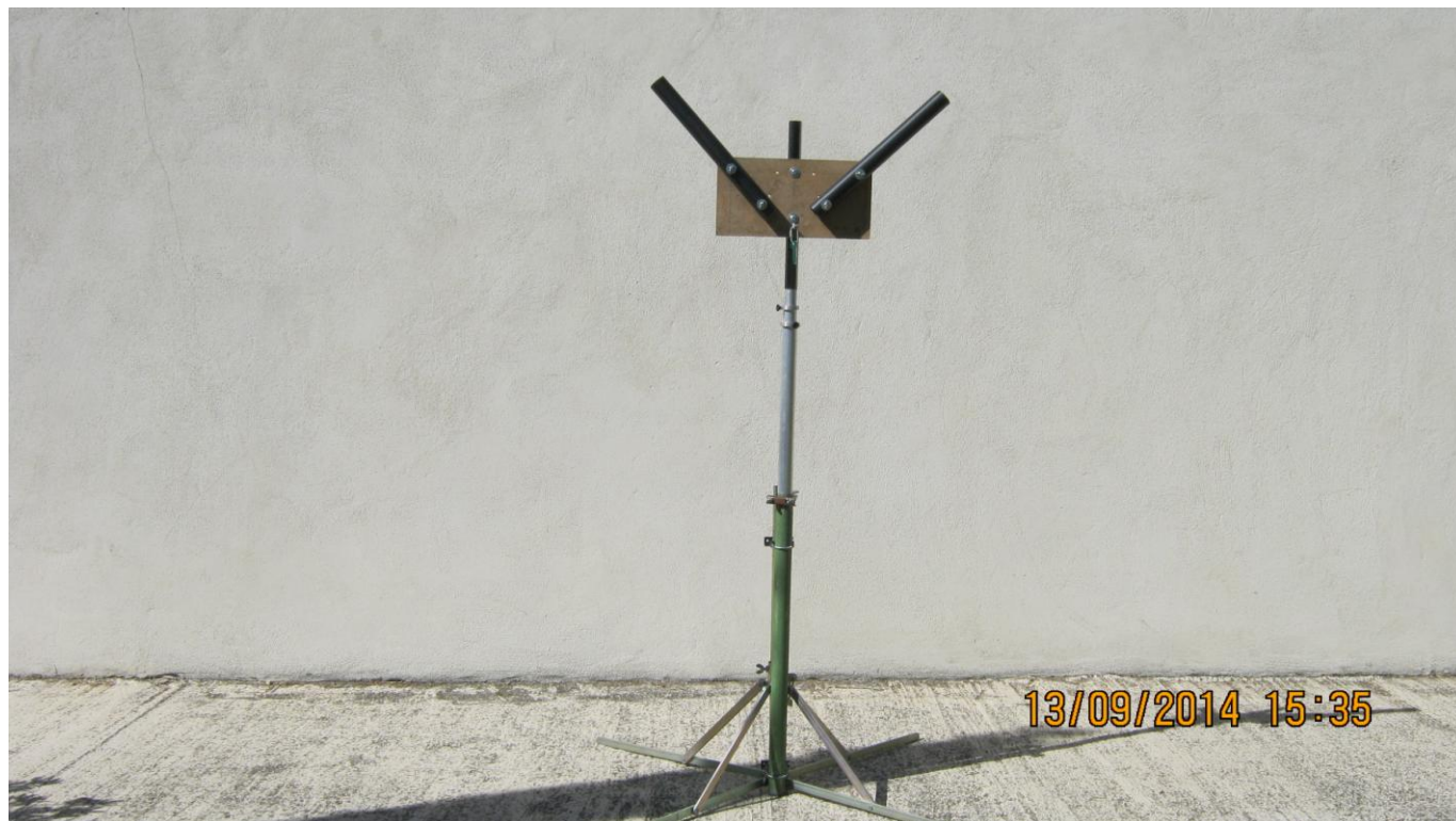
VUE DU SUPPORT EN « V » EN HAUT DU MAT ALUMINIUM REPLIE

La platine support en « V » ne peut ainsi ni tourner par rapport au mat aluminium ni en être arrachée.