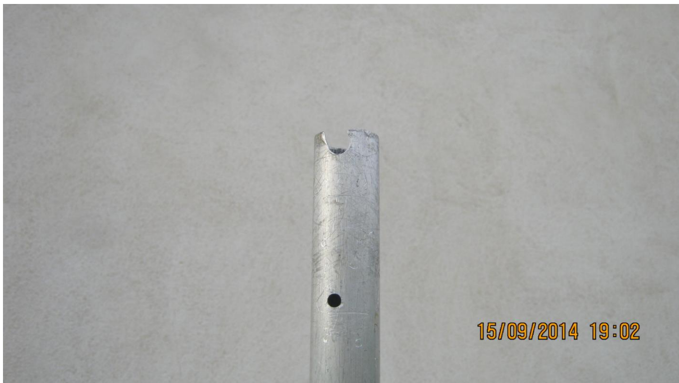
VUE DE L'EXTREMITE SUPERIEURE DU MAT ALUMINIUM

Pour bloquer le mat aluminium il faut serrer assez fort car le tube adaptateur est relativement épais. L'écrou papillon étant assez petit ce serrage ne peut être fait à la main. J'ai donc fabriqué une clef en bois munie d'une fente pour serrer fortement l'écrou ce qui évite d'avoir à penser d'emporter une pince pour le montage et le démontage de l'antenne.