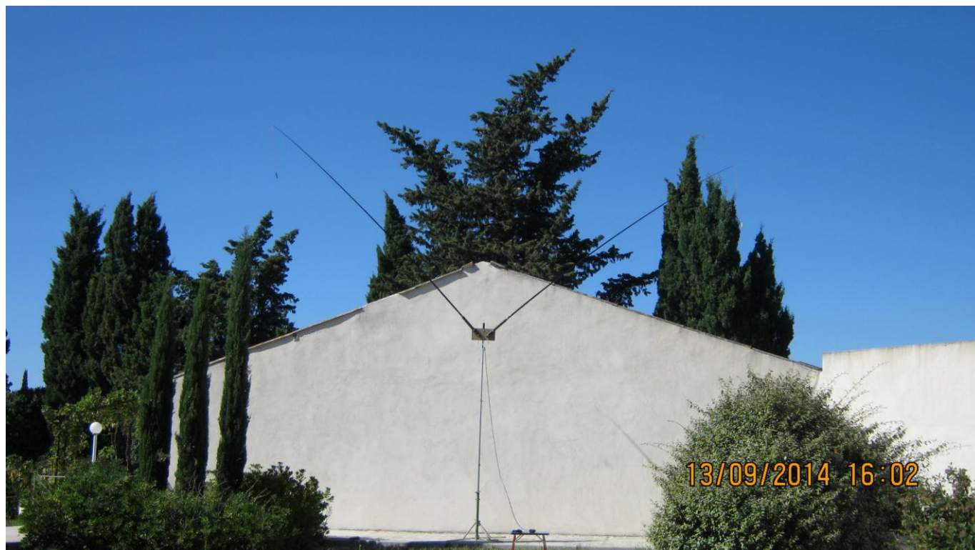
VUE DE L'ANTENNE ENTIERE

Antenne du 40 au 10 mètres Réalisation F6IXH de l'ADRASEC 13