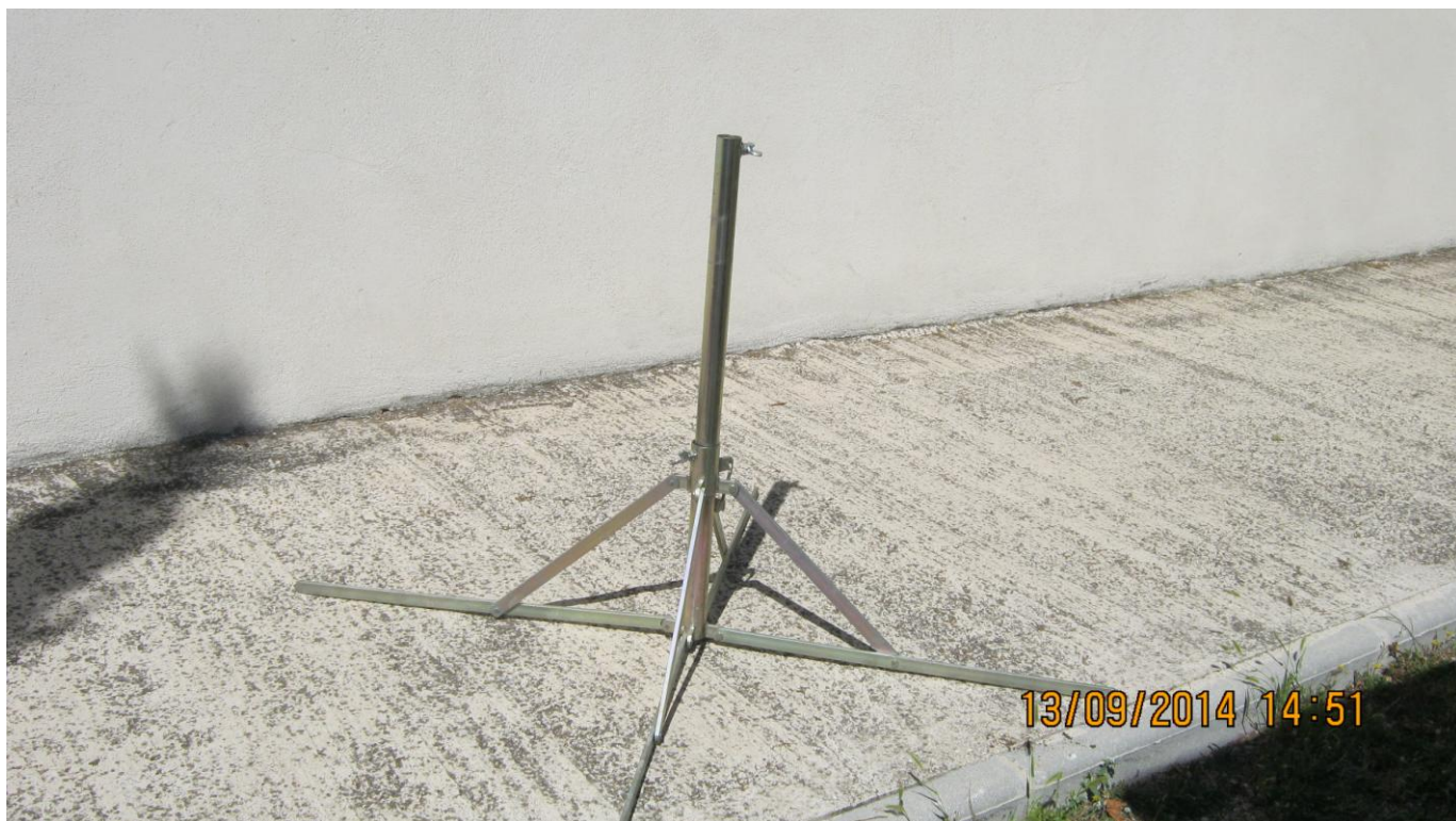
VUE DU PIED DE PARASOL FORAIN

Ce type de pied est assez lourd et beaucoup plus stable que les tripodes grâce à sa forme de croix. Par sécurité il convient cependant de placer sur deux au moins des quatre branches des poids pour augmenter la stabilité.