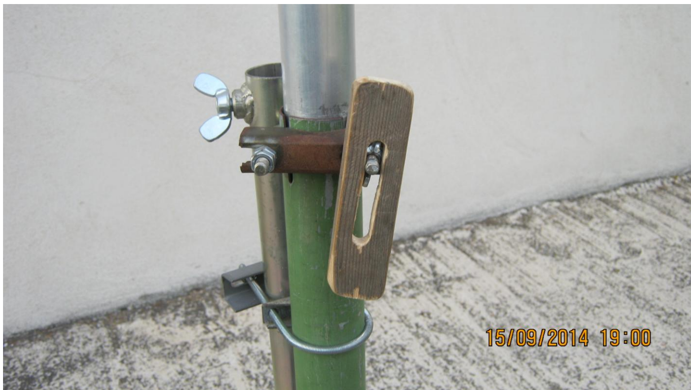
VUE DE LA CLEF DE SERRAGE DE L'ECROU PAPILLON DU SYSTEME DE BLOQUAGE EN ROTATION

Pour bloquer le mat aluminium il faut serrer assez fort car le tube adaptateur est relativement épais. L'écrou papillon étant assez petit ce serrage ne peut être fait à la main. J'ai donc fabriqué une clef en bois munie d'une fente pour serrer fortement l'écrou ce qui évite d'avoir à penser d'emporter une pince pour le montage et le démontage de l'antenne.